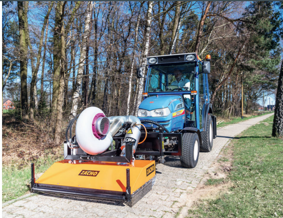
Universeller Einsatz, hier am Beispiel eines ISEKI-Trägerfahrzeuges.