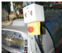
Bedienung von der Kabine aus möglich.