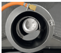
Die Zufuhr und das Zumengen von Gas erfolgt von oben über die Heißluftkanone.