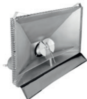
Die erhitzte Luft wird im Prallteller verwirbelt und gleichmäßig verteilt.