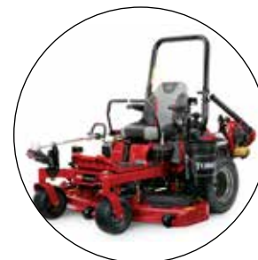
DREIFACH- BEFESTIGUNGSKIT (enthält Halter für Mülleimer, Universalbefestigung und Freischneider-Befestigung) 136-1665