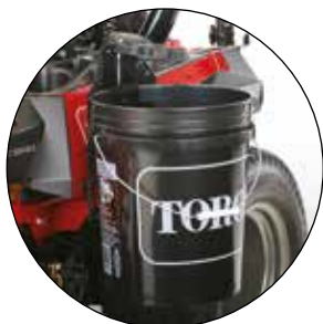
BEFESTIGUNG FÜR EIMER 136-1654