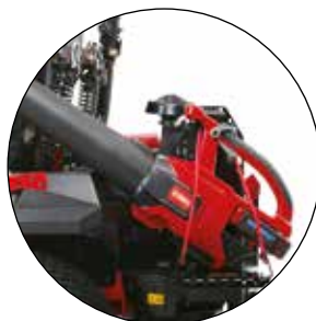
UNIVERSAL- WERKZEUGBEFESTIGUNG 136-1664