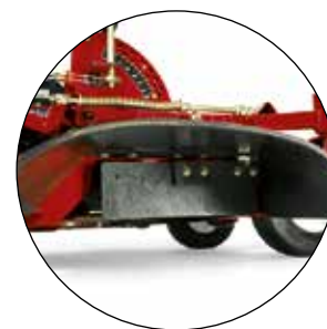
VOM BEDIENER GESTEUERTER AUSWURFKANAL 117-3600