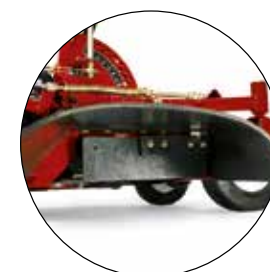
BEDIENERBETÄTIGTES AUSWURFKANALKIT (NUR 30070) 115-4190