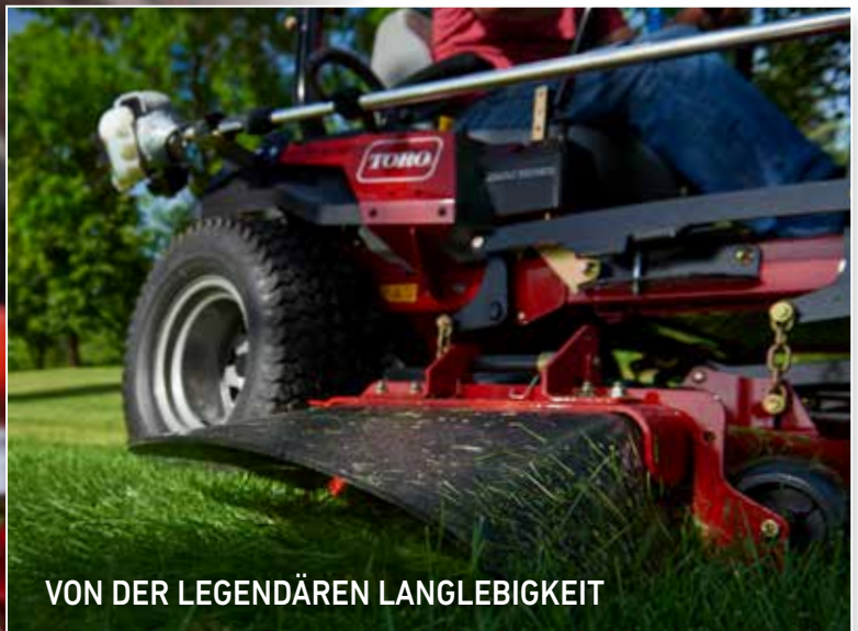
VON DER LEGENDÄREN LANGLEBIGKEIT