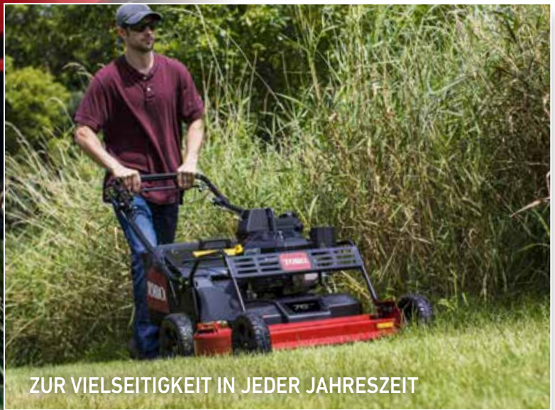
ZUR VIELSEITIGKEIT IN JEDER JAHRESZEIT

©2017 The Toro Company. Alle Rechte vorbehalten.