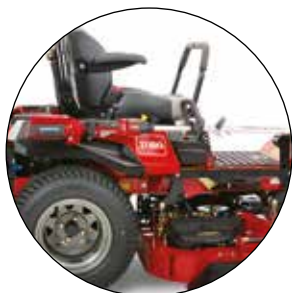
BEFESTIGUNG FÜR FREISCHNEIDER 136-1682