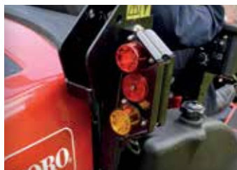
LED-SCHINWERFER MIT BREMSLICHTERN