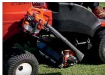
HALTERUNG FÜR GEBLÄSE/ WERKZEUG