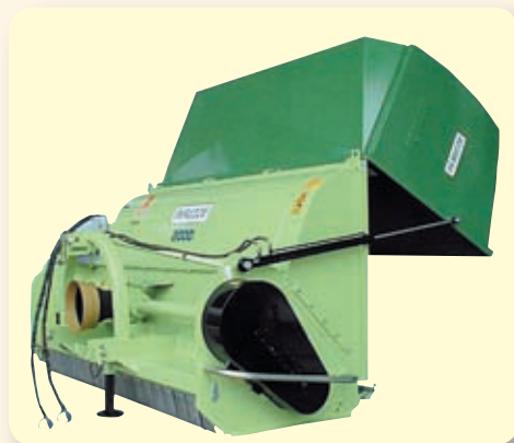
Scarico a terra mediante nr. 2 martinetti idraulici. Ground discharge by nr. 2 hydraulic rams. Bennage au sol avec nr. 2 vérins hydrauliques. Behälter mit Hilfe einer hydraulischen Vorrichtung öffnet.