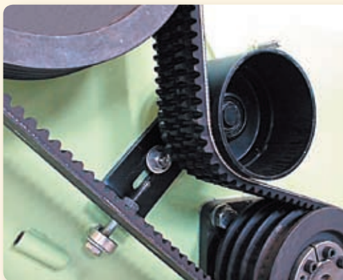
Veloce regolazione tensione cinghie dentate. Easy, quick and sturdy teeth belts tightening. Réglage simple de la tension des courroies. Schnelles und einfaches Nachspannen der Keilriemen.