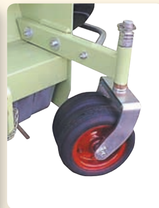
ACCESSORIO/ ACCESSORY ACCESSOIRE/ ZUSATZ Regolazione dell'altezza di taglio su ruote frontali doppie. Height of cut adjustment on front castor double wheels. Réglage simple de la hauteur de coupe sur les roues frontales doubles. Front-Doppelräder, höhenverstellbar.