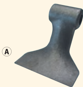
PESO Kg 1