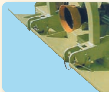
ACCESSORIO/ ACCESSORY ACCESSOIRE/ ZUSATZ Convogliatore per sarmenti. Branches blade conveyer. Lame d'acheminement des sarments. Spezielle Front-Metallplatten zur Zuführung des Schnittgutes zum Mulch-Rotor.