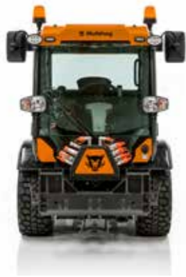
MXC LP SPEZIFIKATION

Eine Maschine - Ein Fahrer - Unendlich viele Anwendungen