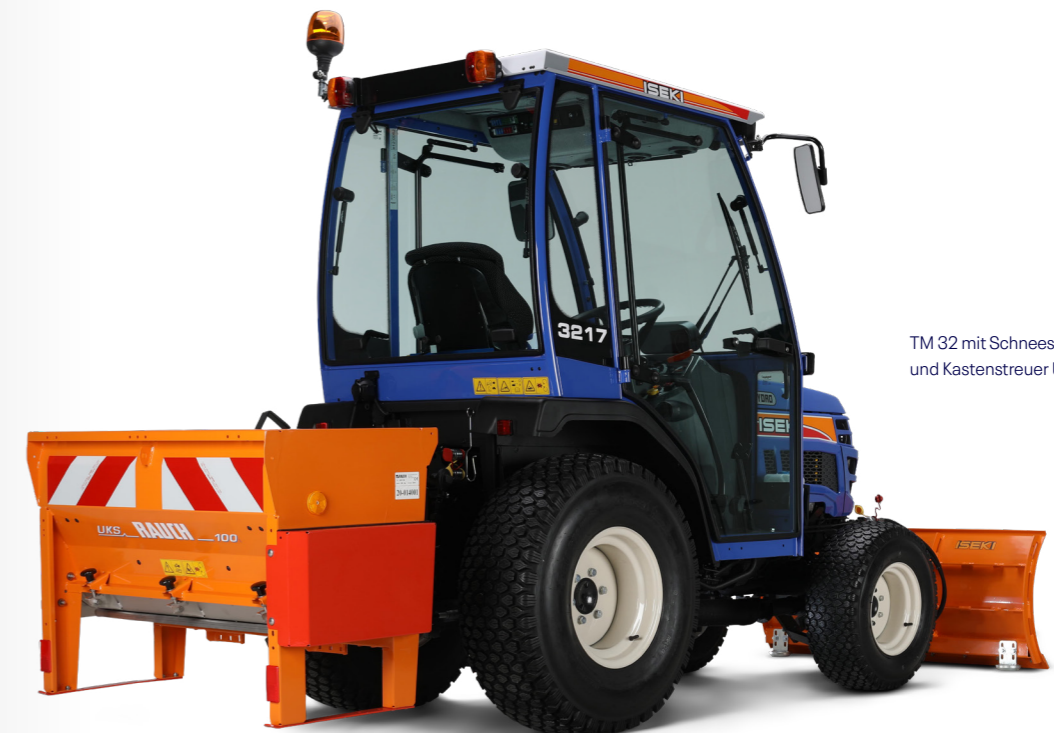
TM 32 mit Schneeschild RSM 130 und Kastenstreuer UKS 100