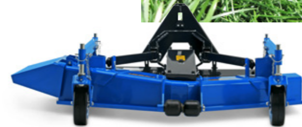
Optional mit ISEKI-Frontmäherwerk zum schnellen An- und Abbau.