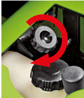
Detailbilder zu den Einstellungen

Wenn der Grasfangkorb voll ist, schaltet sich das Messer automatisch aus , der Schnitt wird sofort unterbrochen. Es besteht auch die Möglichkeit, die Option „Warnton“ zu wählen, welcher durch einen „Piep“ ankündigt, wenn der Korb voll ist. Den vollen Grasfangkorb des FD 220R zu entladen ist einfach! Durch Anheben des Fangkorbs vom Fahrersitz aus öffnet sich die Verschlussklappe automatisch und er wird schnell und komplett entleert. Das Öffnen und Schließen des Deckels ist automatisch mit Magnetschließung und erweist sich als widerstandsfähig in Hinblick auf Einstellungen und Verschleiß.