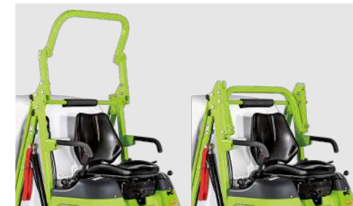
klappbarer Überrollbügel serienmäßig