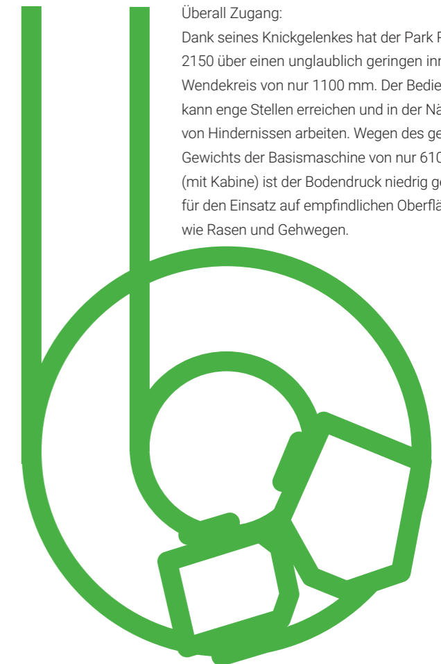
300 cm Wendekreis - Kante zu Kante